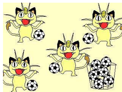
Figura 2: Estímulo visual para a condição de objeto extra múltiplo (SUGISAKI E ISOBE, 2001)

Esses resultados parecem sugerir que crianças entre 4 e 5 anos teriam o conhecimento linguístico requerido para analisar corretamente estruturas contendo o quantificador universal, em consonância com as hipóteses da competência integral (cf. CRAIN et al., 1996). Segundo essas abordagens, as crianças